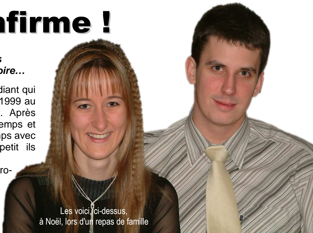
Les voici, ci-dessus, à Noël, lors d'un repas de famille

Ils se marièrent et eurent beaucoup d'enfants... ☺